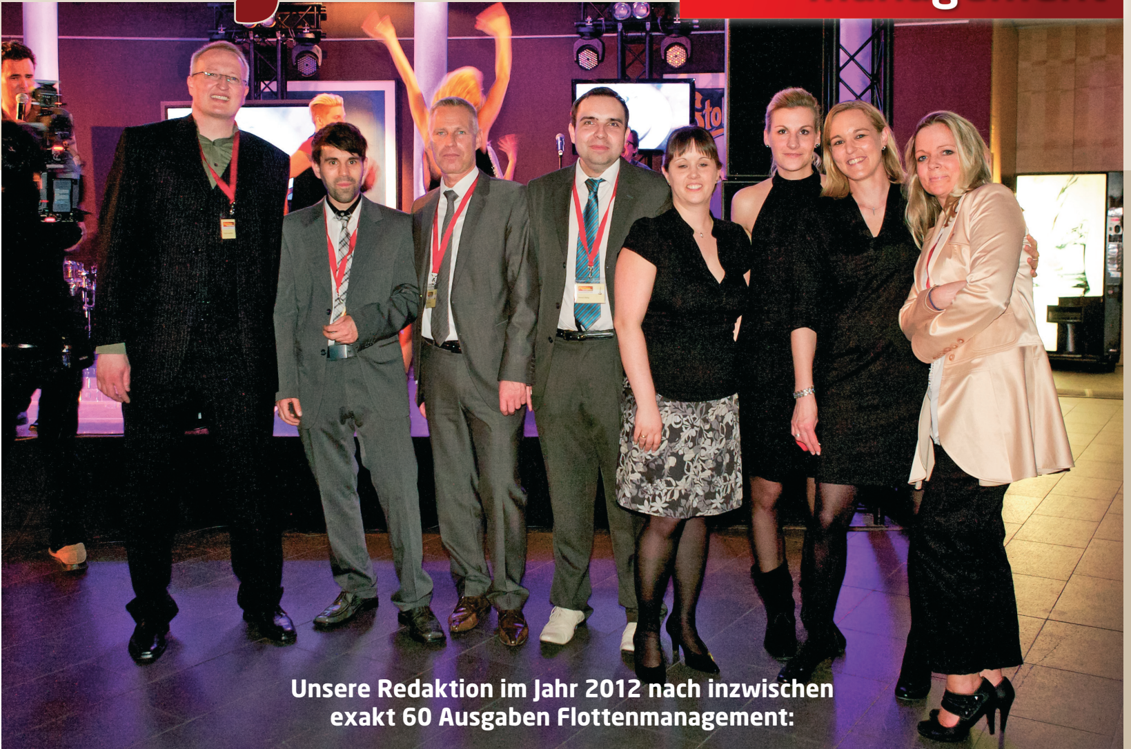
Unsere Redaktion im Jahr 2012 nach inzwischen exakt 60 Ausgaben Flottenmanagement: